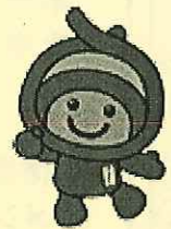
上尾市のマスコット「アッピー」