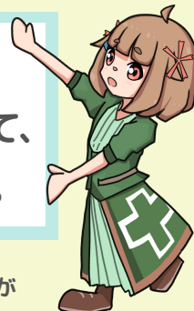
埼玉さんぽマスコット 「守（まもり）ちゃん」