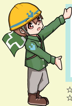
埼玉さんぽマスコット 「健（けん）ちゃん」

地域産業保健センター（地さんぽ）では、 労働者数50人未満の小規模事業場を対象として、 医師からの意見聴取を 無料 で実施しています。