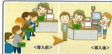
レジの精算時間が1.5倍の速さになり、預り金や釣銭の受け渡しの間違いがなくなった