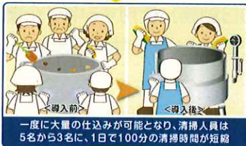
一度に大量の仕込みが可能となり、清掃人員は5名から3名に、1日で100分の清掃時間が短縮