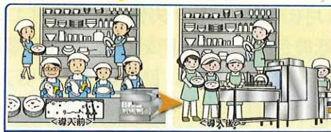
洗浄人員は6名から5名に、食器洗浄・乾燥時間が2/3に短縮