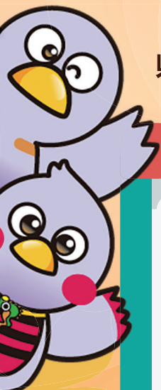
埼玉県マスコット 「コバトン」 「さいたまっち」