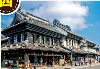
蔵造りの町並み(川越市)