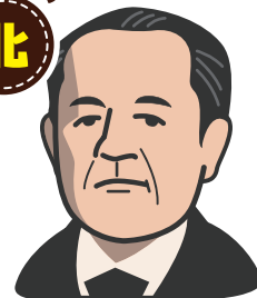
渋沢 栄一 (深谷市)